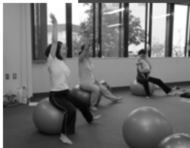
▲西岡福住まちづくりセンターで行われた バランスボールを使った体操講座の様子